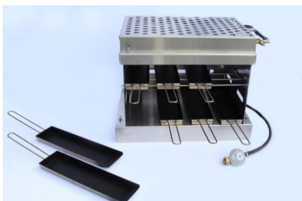
Chäsbrätelofen mit 10 Pfännchen für bis zu 200 Portionen pro Stunde